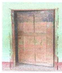
Foto 3: Sustitución de soporte de puertas de madera por metal modulo 1 y 2